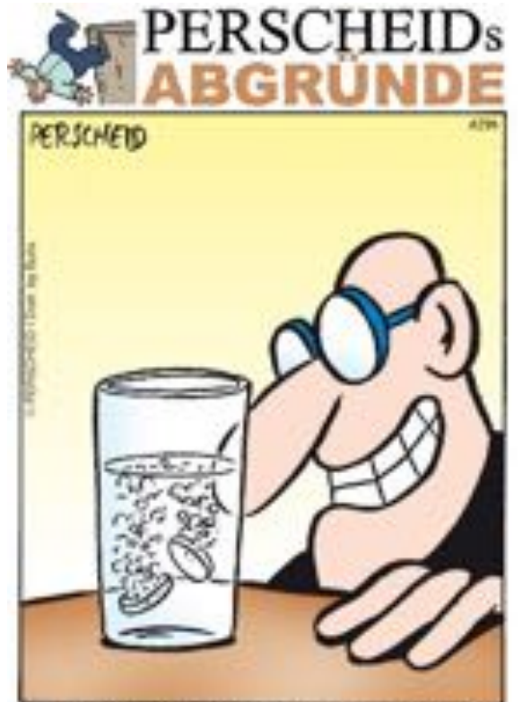
VIELE SAHNEN SCHÄTZEN DEN ANBLICK VON SICH IM TODESKAMPF BEFINDLICHEN BRAUSETABLETTEN.