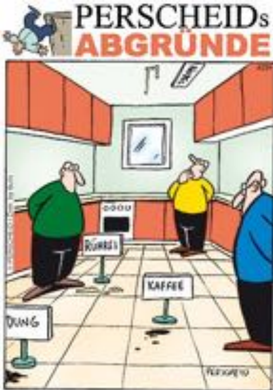
BRÜHEWANNI HATTE MARSIN DIE PIRGIG SÄHE UND ERÖFFNETE EIN FLECKBARNEUM.